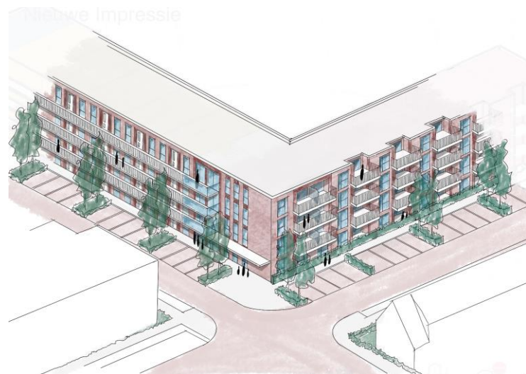
Impressie: één van de eerste schetsen van het gebouw, hoek Ambachtsherenweg/Kerklaan.

We informeren u graag over het project 'Ambachtsherenweg/ Kerklaan – Rijnhart Wonen'. Dit project gaat over het vernieuwen van een oud appartementencomplex aan de Ambachtsherenweg en de Kerklaan. Het bestaande gebouw is verouderd en voldoet niet meer aan de eisen van deze tijd. Rijnhart Wonen is van plan dit gebouw te vervangen door een nieuw complex met 47 huurappartementen, waaronder sociale en middenhuur woningen. Hiervoor is ook gemeentegrond nodig. Daarnaast is een gedeeltelijke herinrichting van de omgeving rondom het gebouw nodig.